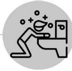
القيء أو التهوع بعد السعال