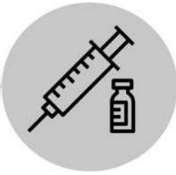
احصل على التلقيح (DTaP) للأطفال ، (Tdap للبالغين)