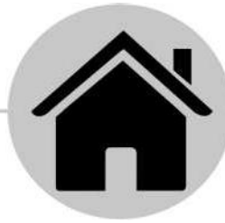
ابق في المنزل عندما تكون مريضا