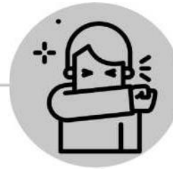
قم بتغطية سعالك باستخدام كم القميص