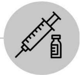
接种疫苗(儿童接种DTaP疫苗，成人接种Tdap疫苗)