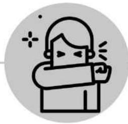
Cúbrase la boca con la manga al toser