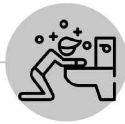
Vómitos o arcadas después de toser