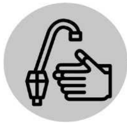
Lávese las manos con frecuencia